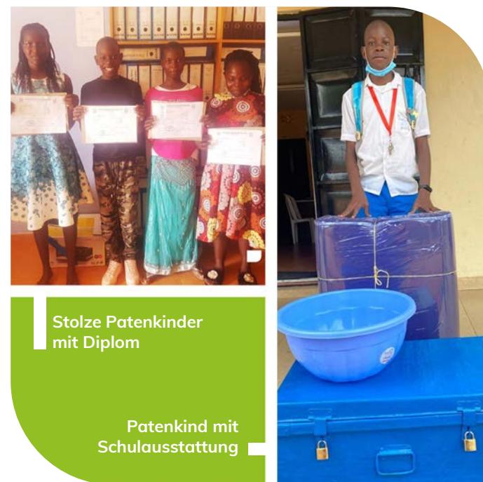
Stolze Patenkinder mit Diplom